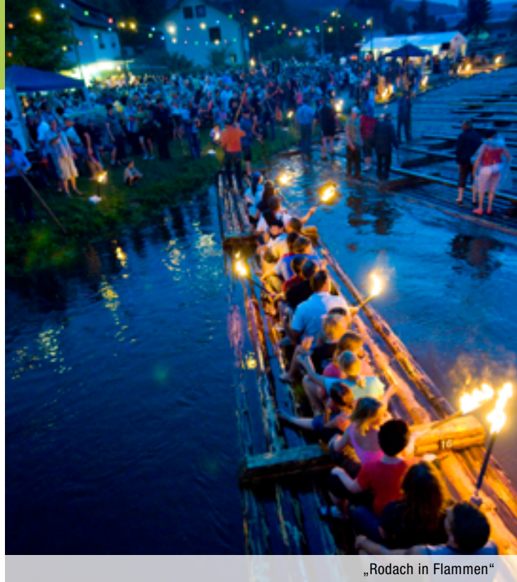
„Rodach in Flammen“